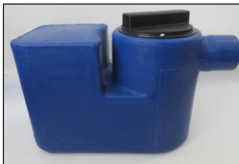
Esempio di posizionamento